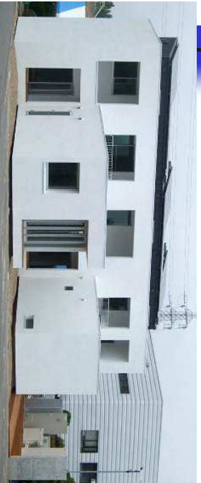
技術研究所 スマートエネルギーハウス