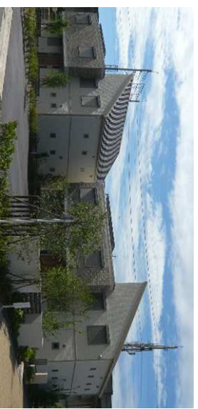
岐阜市 スマートエネルギーハウス(集合住宅)