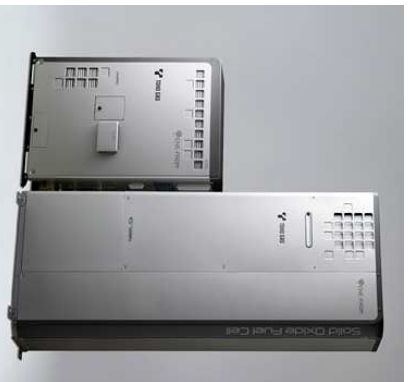
エネファームtypeS(家庭用SOFC) 販売開始